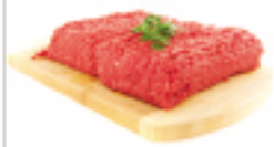
Carne molida (especial)