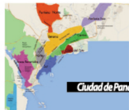
Ciudad de Panamá