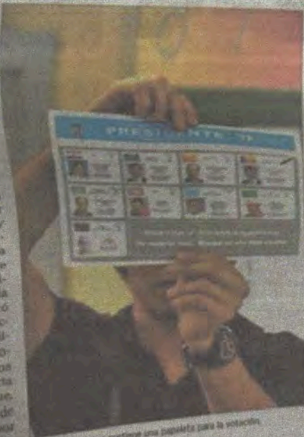
Un hombre sostiene una papalote para la votación.

La Cámara de Comercio, Industrias y Agricultura de Panamá (CCIAP) indicó que "el futuro inmediato del país está en manos de los electores", por lo que hizo un llamado a "ejercer el derecho y cumplir con la alta responsabilidad, concurrendo a los comicios con información suficiente sobre por quién vamos a votar, y por qué vamos a hacerlo". La CCIAP que llevó a cabo el último debate electoral entre los aspirantes a la presidencia de la República destacó que "siente la satisfacción de haberle cumplido a la sociedad nacional al permitirle una aproximación directa con los candidatos que en representación de partidos políticos y por libre postulación, se presentarán a competir.